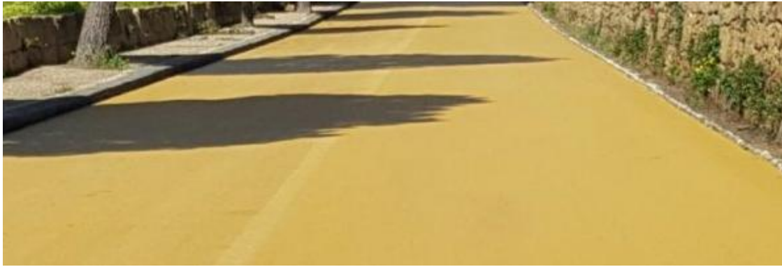
Nuova pavimentazione: Previsione Progettuale

Ciò, con il potenziamento dei servizi igienici, la sistemazione del verde e di un miglioramento generale dell'area commerciale e del parcheggio, consentirà non solo di ridare il dovuto e giusto decoro al sito archeologico, ma consentirà a tutti gli "attori" che si occupano promozione e di accoglienza turistica, di sfruttare ogni minima risorsa presente per richiamare nuovi visitatori ed aumentare e divulgare nel mondo la conoscenza di una grande risorsa culturale quale è la Villa Romana del Casale e dalla nostra Sicilia.