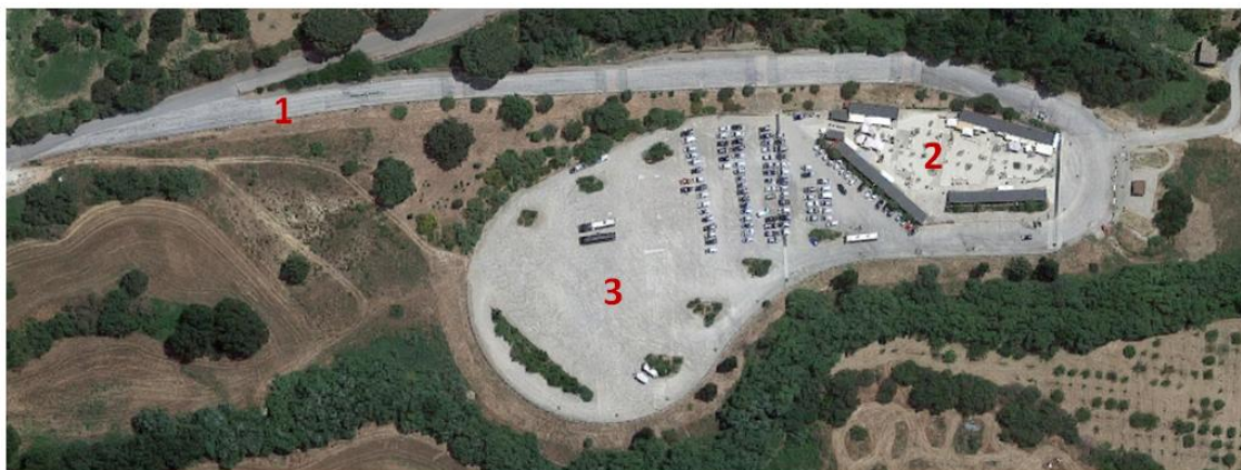
1) Strada di accesso; 2) Area Commerciale; 3) Area di Parcheggio;