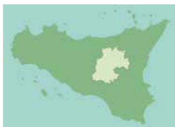
La provincia di Enna

Il decennio 2000-2009 ha messo in mostra movimenti turistici altalenanti nella provincia di Enna, con un andamento di arrivi e presenze simile nella prima parte del periodo ed una differenziazione nell'ultimo biennio.