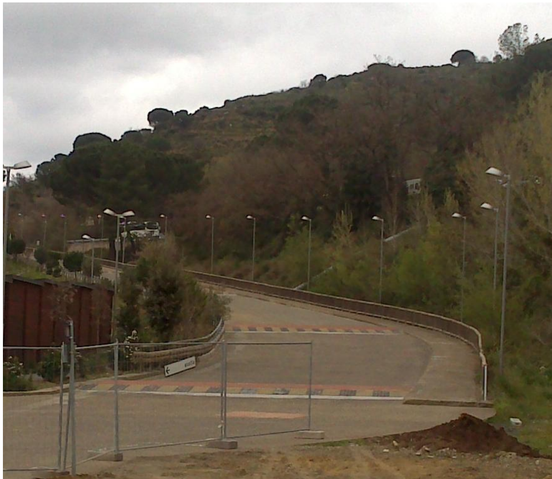
Strada di accesso a valle