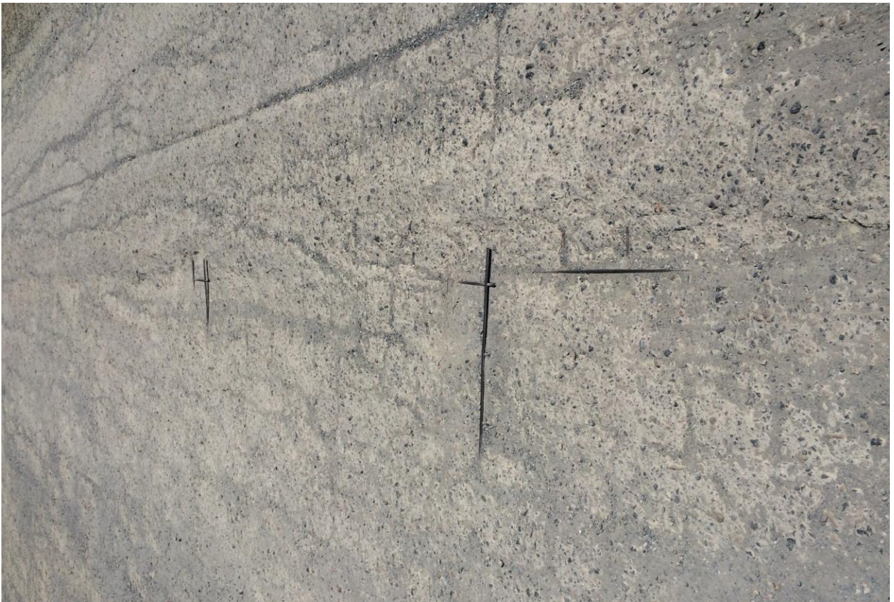
Particolare dell'usura della pavimentazione in calcestre impoverito