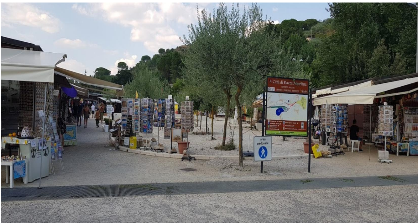
Area Commerciale: altra vista