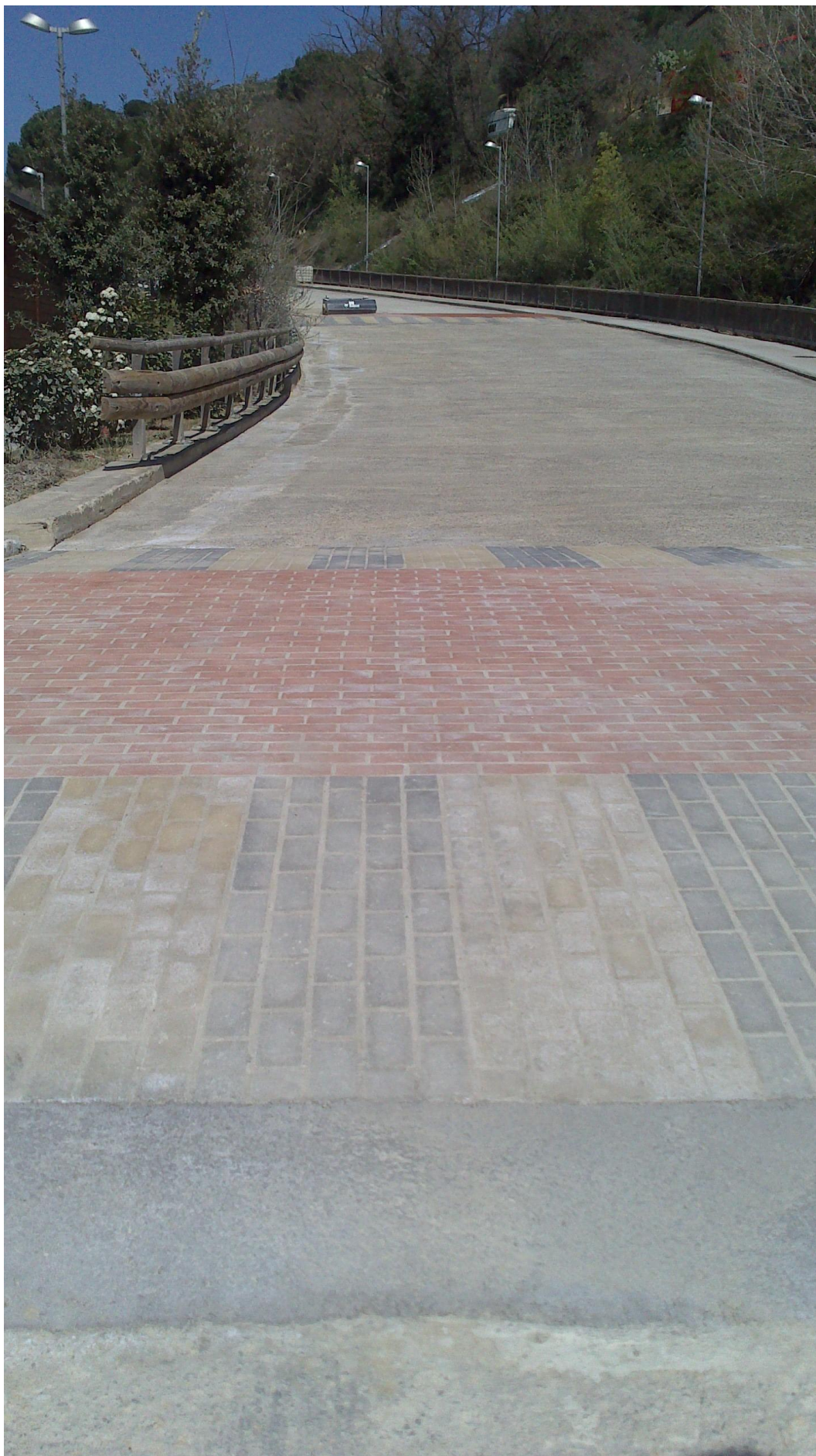
Strada di accesso particolare del dosso a valle