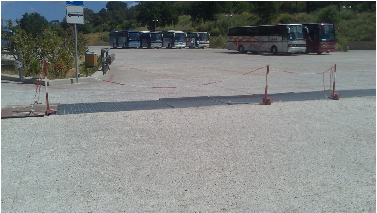
Area parcheggio transennamento canale raccolta acque meteoriche per dissesto griglia