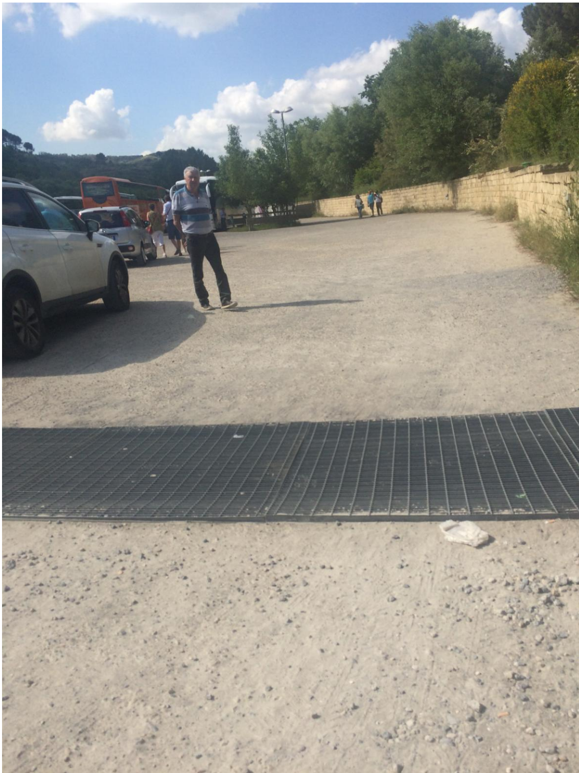
Usura della pavimentazione in calcestre impoverito e dissesto della griglia metallica a copertura del canale di raccolta delle acque meteoriche