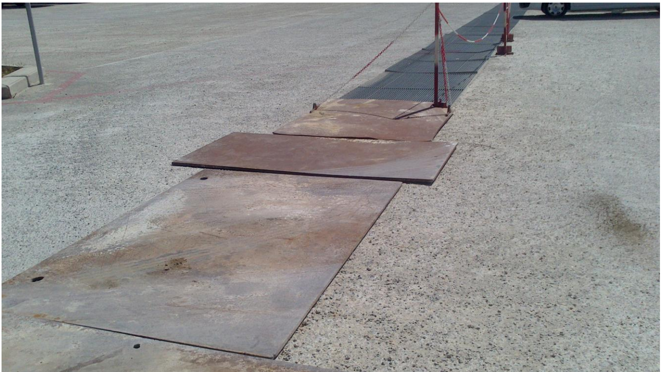
dissesto della griglia metallica a copertura del canale di raccolta delle acque meteoriche