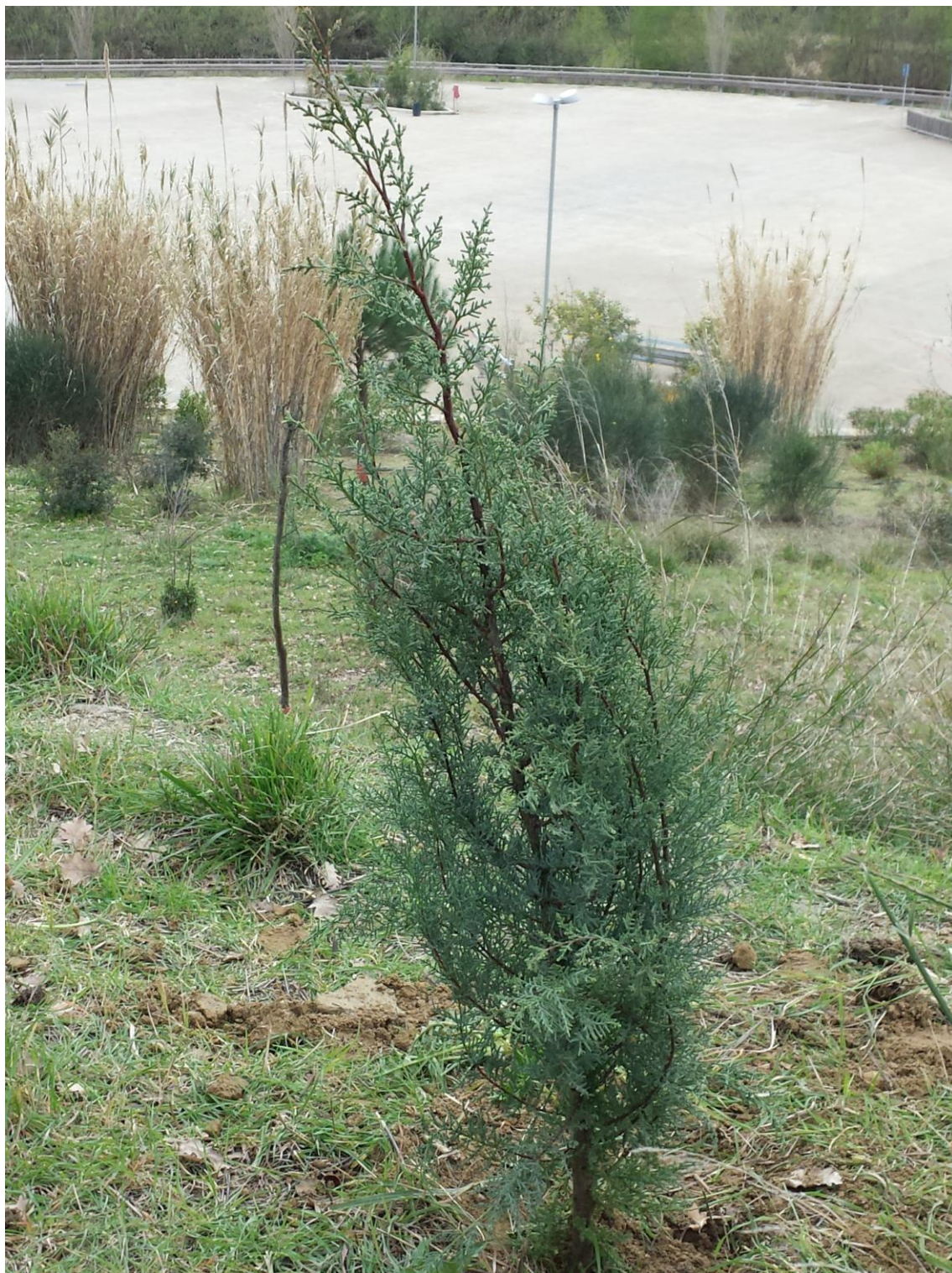
pendici strada di accesso