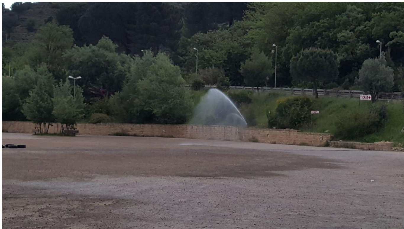
Zona parcheggio durante la bagnatura della pavimentazione