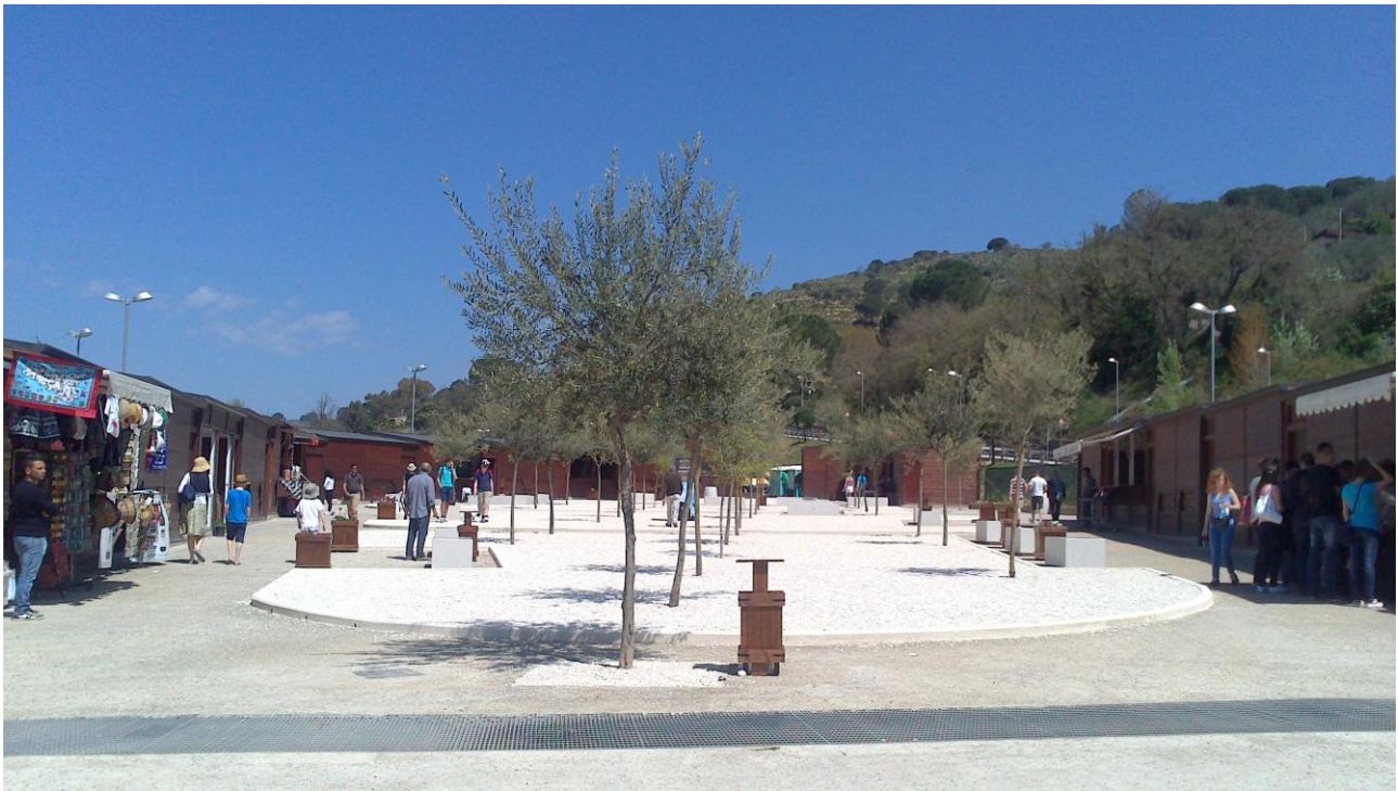
Area Commerciale ingresso